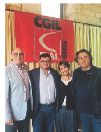
VII CONGRESSO I segretari

«La riforma della Fornero da parte del Governo riguarda pochi lavoratori»