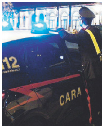
CENTRO Una gazzella dei Cc

Ladro di biciclette incastrato dai militi per analogo furto