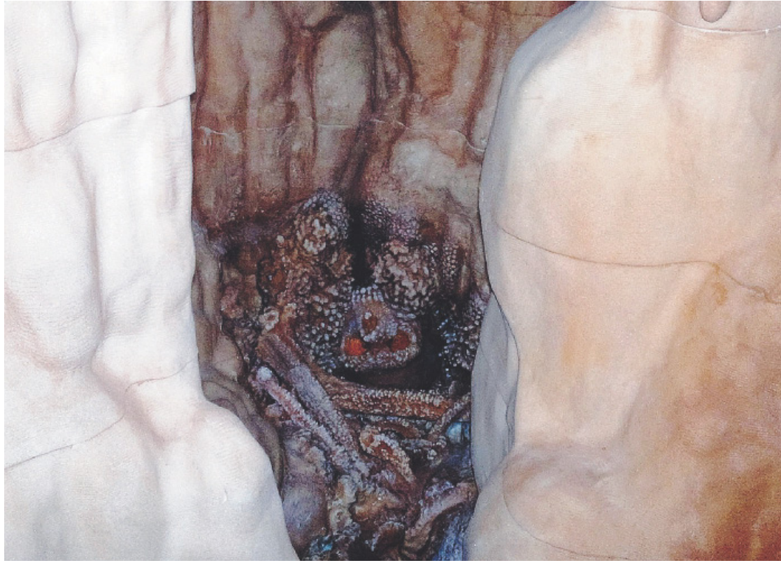
ALTAMURA La ricostruzione della grotta dell'Uomo preistorico a Palazzo Baldassarre