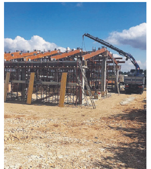
SANTERAMO Il cantiere del Centro per il riuso

teramo, i cittadini potranno conferire i beni che non intendono più usare come mobili, elettrodomestici, oggetti elettronici, capi di abbigliamento e che, pur essendo ancora funzionalmente validi, sarebbero destinati a diventare rifiuti destinati alla discarica, mentre potrebbero essere ritirati dal Centro adibito a mercatino del riuso da coloro che ne avessero bisogno». Il Centro insomma avrà una doppia valenza: ridurre il numero di rifiuti destinati alla discarica e andare incontro a quei cittadini bisognosi che possono ottenere beni a titolo totalmente gratuito e in buone condizioni. Intanto a settembre la quota di differenziata fa registrare un aumento rispetto ad agosto: dal 58 al 65 per cento.