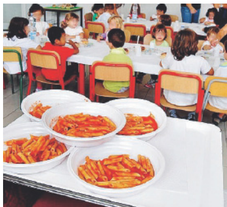
GRAVINA Da lunedì comincia la mensa

Ma le famiglie dei bambini lamentano il rincaro dei pasti rispetto alle tariffe dell'anno scorso