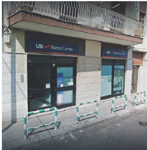
COMUNITÀ La sede della banca Carime